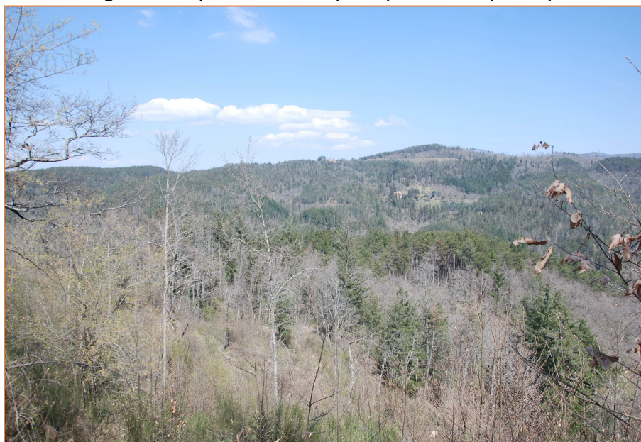
Complesso "Alpe di Poti": I nuclei di conifere dell'area di Scopetone - Valle

I rimboschimenti di conifere caratterizzano il nucleo di Scopetone -Valle e più limitatamente le aree sommitali del Nucleo di Monte Dogana mentre negli altri nuclei le conifere costituiscono solo piccole parcelle sparse all'interno dei soprassuoli di latifoglie su superfici un tempo a pascolo e prato pascolo