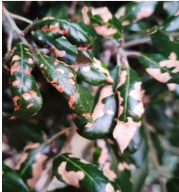
antracnosi da Sphaceloma quercus-ilicis su foglie di leccio

L'antracnosi causata da attacca la vegetazione tenera (foglie e germogli) provocando tacche necrotiche di misura variabile ma non crea mai danni reali alla pianta. E' una malattia che compare solo nei periodi freschi e piovosi con temperature variabili dai 18 ai -24°C.