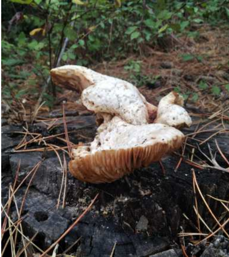
Complesso Alpe di Poti : carpofori di Neolentinus lepideus su ceppaia di pino nero