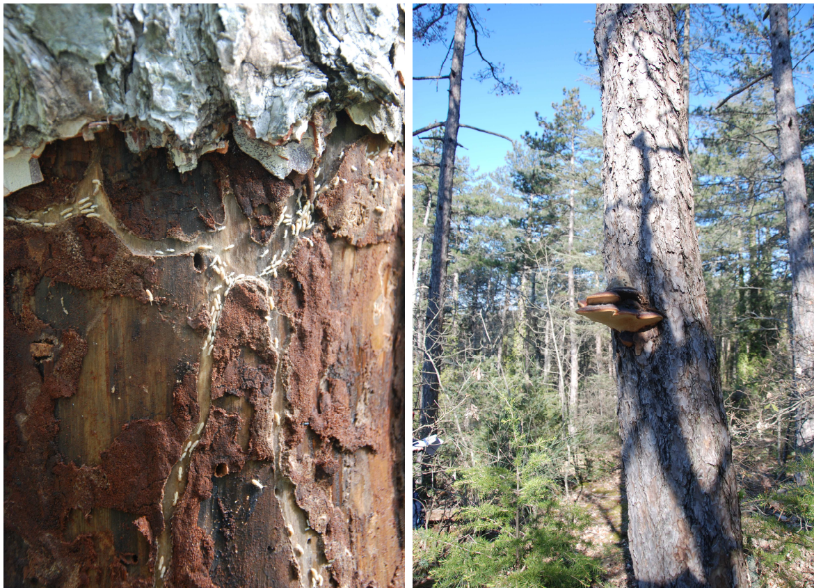
Complesso Alpe di Poti: foto sx loc. Ranchetto colonia di termiti sotto la corteccia di pino nero Foto Ds Loc. Ciliegino (Scopetone) pianta di pino con presenza di carpofori maturi di Fomitopsis pinicola foto Toccafondi P.

Le piante attaccate da questi coleotteri subiscono gravi danni fisiologici ma di norma sopravvivono per molto tempo, però il loro declino può essere accelerato dall'intervento di altri insetti xilofagi quali gli isotteri calotermitidi e rinotermitidi, imenotteri formicidi etc, oltre che da funghi agenti delle carie, come da noi osservato indagando sotto la corteccia a livello del colletto su varie ceppaie o sui fusti di piante deperienti. In effetti la colonizzazione del legno morto o di parte di esso di piante deperenti inizia con l'attacco di insetti xilofagi "primari" quali i coleotteri scolitidi per poi proseguire e terminare con le colonizzazioni di specie meno esigenti che vivono nel suolo quali "le Termiti" che si insediano spesso all' interno delle gallerie prodotte dai grandi coleotteri saproxilici "secondari" e/o in presenza di funghi fitopatogeni.