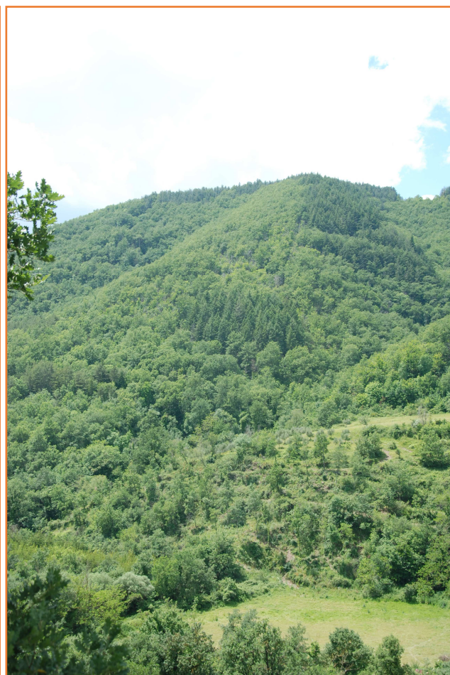
Complesso "Alpe di Poti": foto sx nucleo Scopetone -loc. Valle – foto ds nucleo Ranchetto loc. Giglioni – foto Toccafondi P