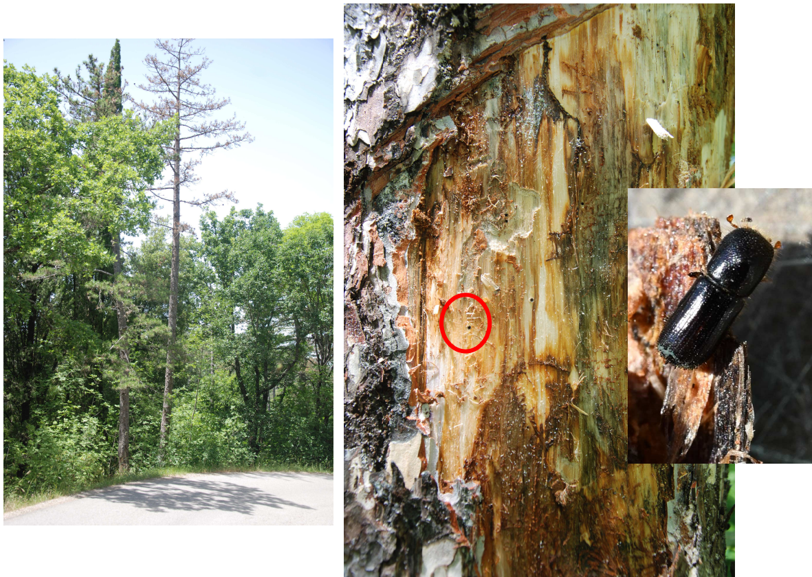
Complesso Alpe di Poti: Scopetone piante di pino deperienti attaccate da X.eurygraphus di cui si evidenziano i piccoli fori di penetrazione (cerchio rosso) degli adulti nel legno

La presenza generalizzata di piante deperienti, sottomesse o cadute al suolo in seguito a sradicamenti o schianti, ha contribuito senz'altro al diffondersi di questo xilofago secondari che hanno determinato la fine più o meno repentina degli alberi colonizzati .