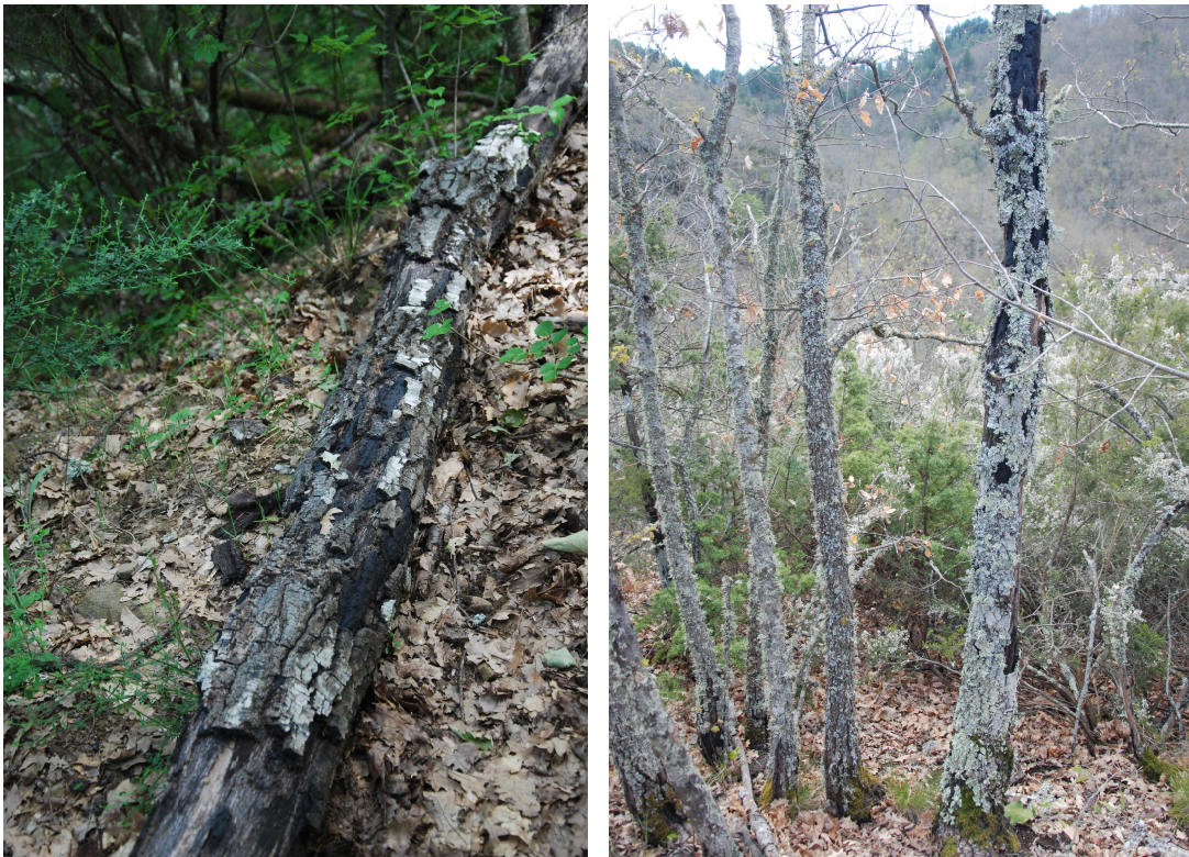
Complesso Alpe di Poti: in sequenza nucleo Scopetone e nucleo San Cassiano – morie di piante e polloni di cerro a seguito di attacchi del "cancro carbonioso"

L'incidenza della malattia, allo stato attuale, non è elevata, anche se alcune aree del complesso poste in situazioni edafiche difficili (Nucleo di san Cassiano e Nucleo Ranchetto) in presenza di eventuali attacchi di insetti defogliatori si possono determinare le condizioni di un aumento dell'inoculo fungino con possibili ripercussioni sulle formazioni quercine .