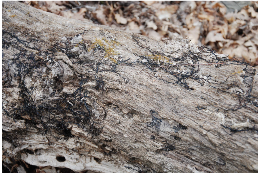
Rizzomorfe tipiche di Armillaria sp.pl. su legname di latifoglia

per molte piante di conifere che di latifoglie. A. mellea è considerata un parassita molto pericoloso sia per molte piante non solo di latifoglie ma anche di conifere.