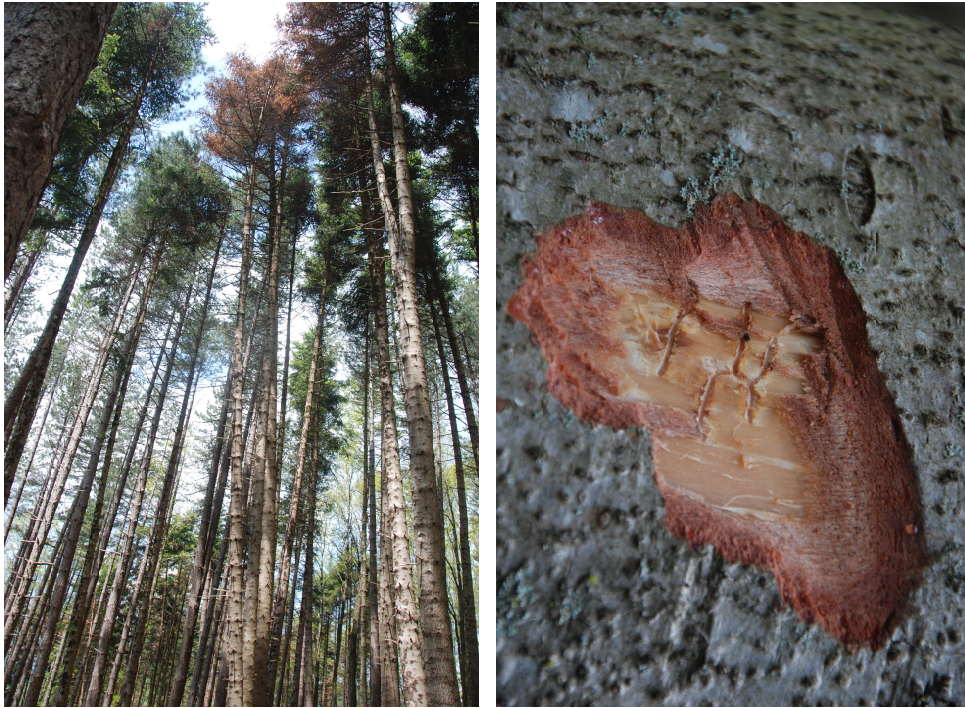
Complesso Alpe di Poti: foto Monte Dogana morie di abete bianco a seguito di attacchi di P.curvidens di cui si evidenziano le caratteristiche gallerie materne sottocorticali

In ogni caso nel comprensorio indagato nei popolamenti naturali la presenza dei citati xilofagi risulta spesso associata a schianti o sradicamenti o comunque a stati di indebolimento delle piante originati da cause diverse. Negli impianti dette specie sembrano approfittare di stati di sofferenza indotti da marciumi radicali, specialmente nei settori in cui si hanno frequenti ristagni d'acqua.