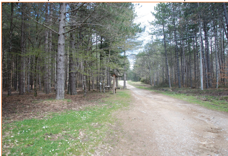
Complesso "Alpe di Poti": I nuclei di conifere dell'area di monte Dogana