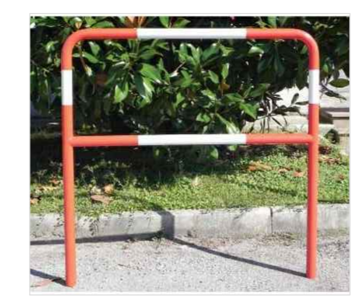
particolare parapetone sezione 63° progressiva 2036.58 m tipo barriera parapetone in tubo acciaio Dn48 - 120x100x20 verniciatura a polvere, piastra saldata fissata mediante tasselli

PARTICOLARE PARAPETTO Da Sez. 42 a Sez. 43 zona raccordo pendenza ponte su Torrente Gavardello Da Sez. 56 a Sez. 63 La parte infissa dei pali deve essere preventivamente carbonizzata superficialmente o protetta con strato di catrame La giunzione tra gli elementi deve essere eseguita con chiodi zincati da legno con testa ribattuta fino ad assottigliamento La protezione dell'accesso al ponte su Gavardello deve essere facilmente sfidabile mediante anellatura ai giunti dei pali infissi con sabbia e giunzioni con vitigni zincata