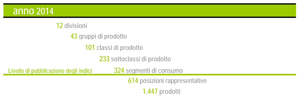
PROSPETTO 1. STRUTTURA DELLA CLASSIFICAZIONE ADOTTATA PER GLI INDICI 2014 (a)

(a) Gli indici NIC sono diffusi con un livello di dettaglio che giunge ai 324 segmenti di consumo; per gli utenti che ne facciano richiesta, sono disponibili gli indici elementari delle 614 posizioni rappresentative.