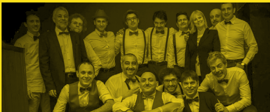
SUNRISE JAZZ ORCHESTRA