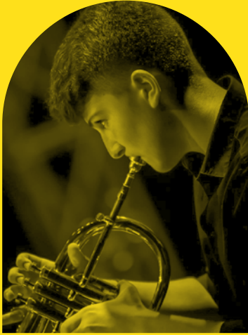
GAETANO CASTIGLIA Trombettista, artista emergente