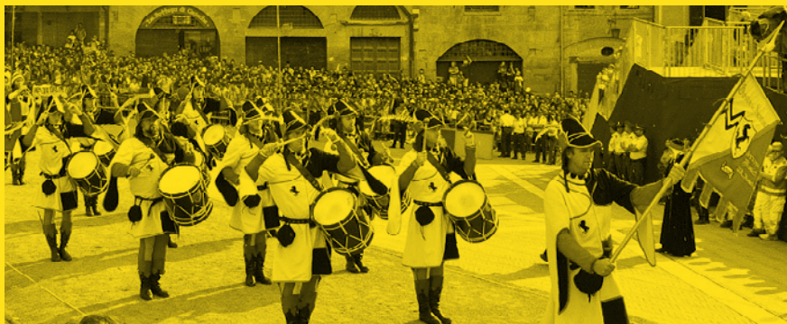
I MUSICI DELLA GIOSTRA DEL SARACINO