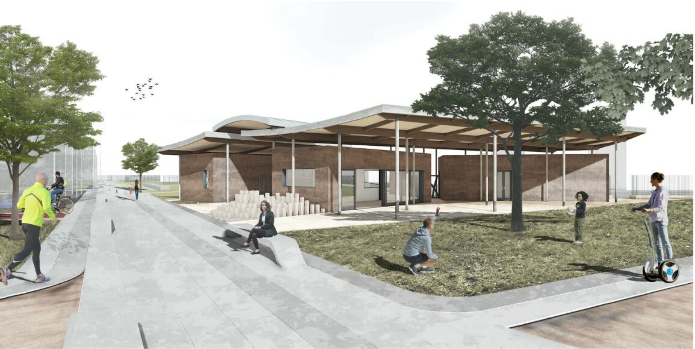
Vista dal percorso principale