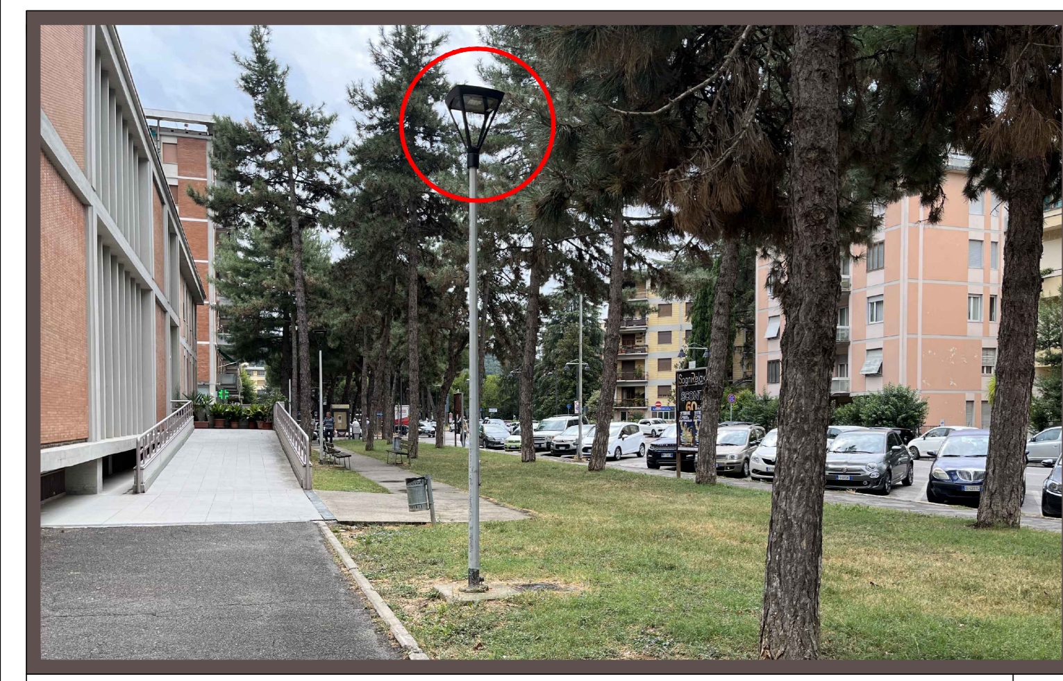
03 - Vista del pedonale sul fianco laterale della Parrocchia Del Sacro Cuore FT