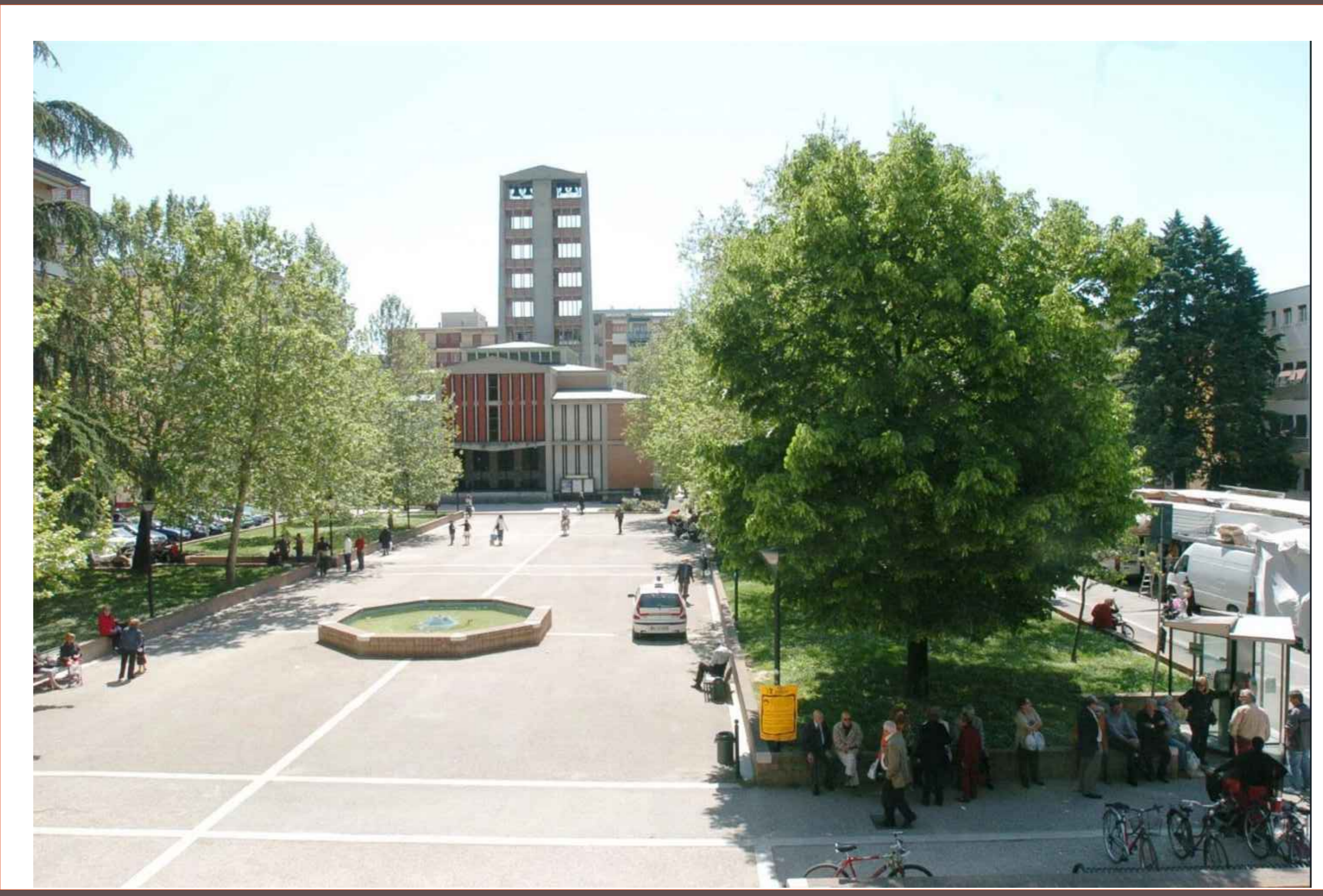
01 - Vista della Piazza Giotto con la Parrocchia del Sacro Cuore in lontananza AR