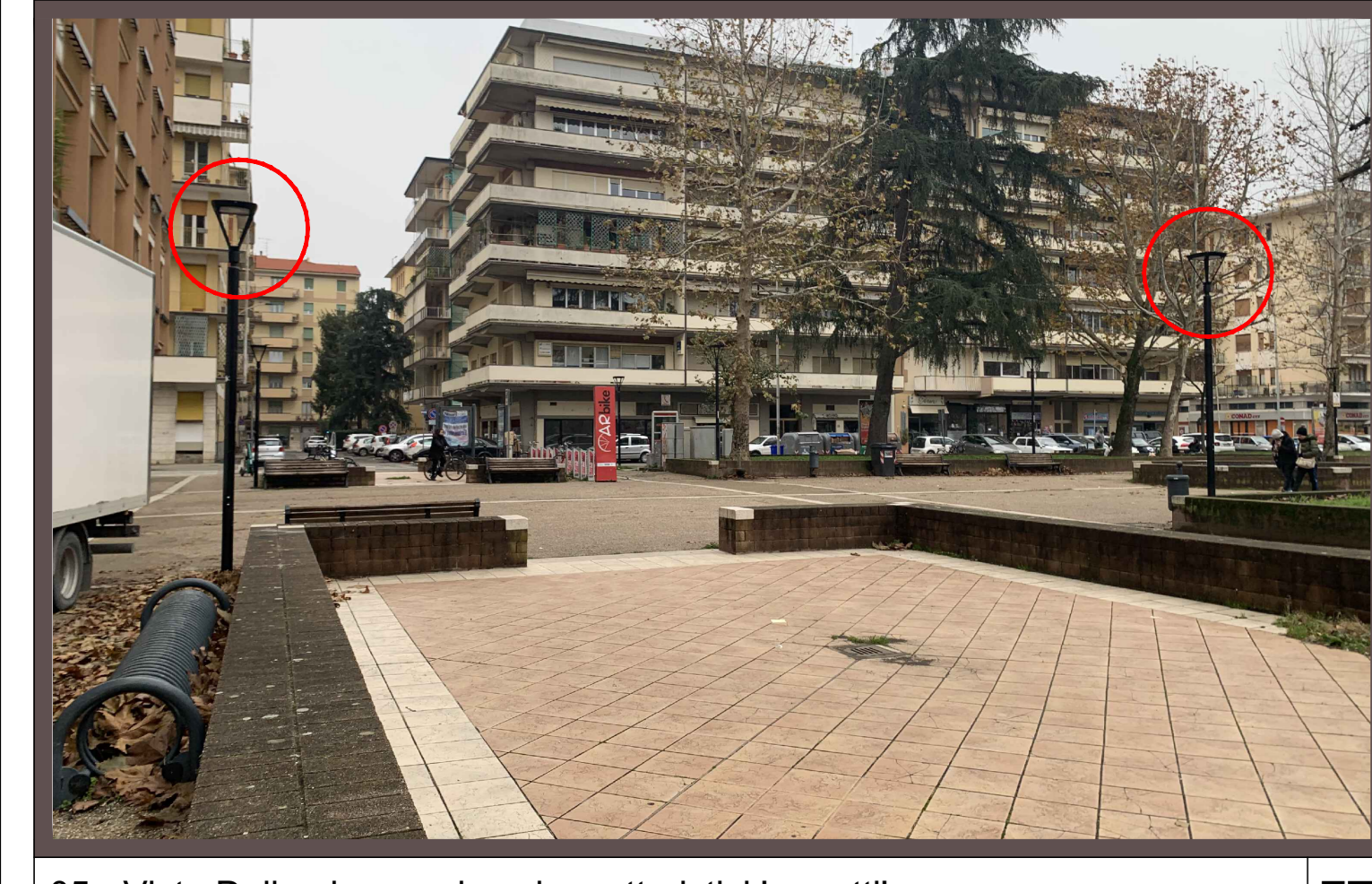
05 - Vista Della piazza e i suoi caratteristici 'muretti' FT