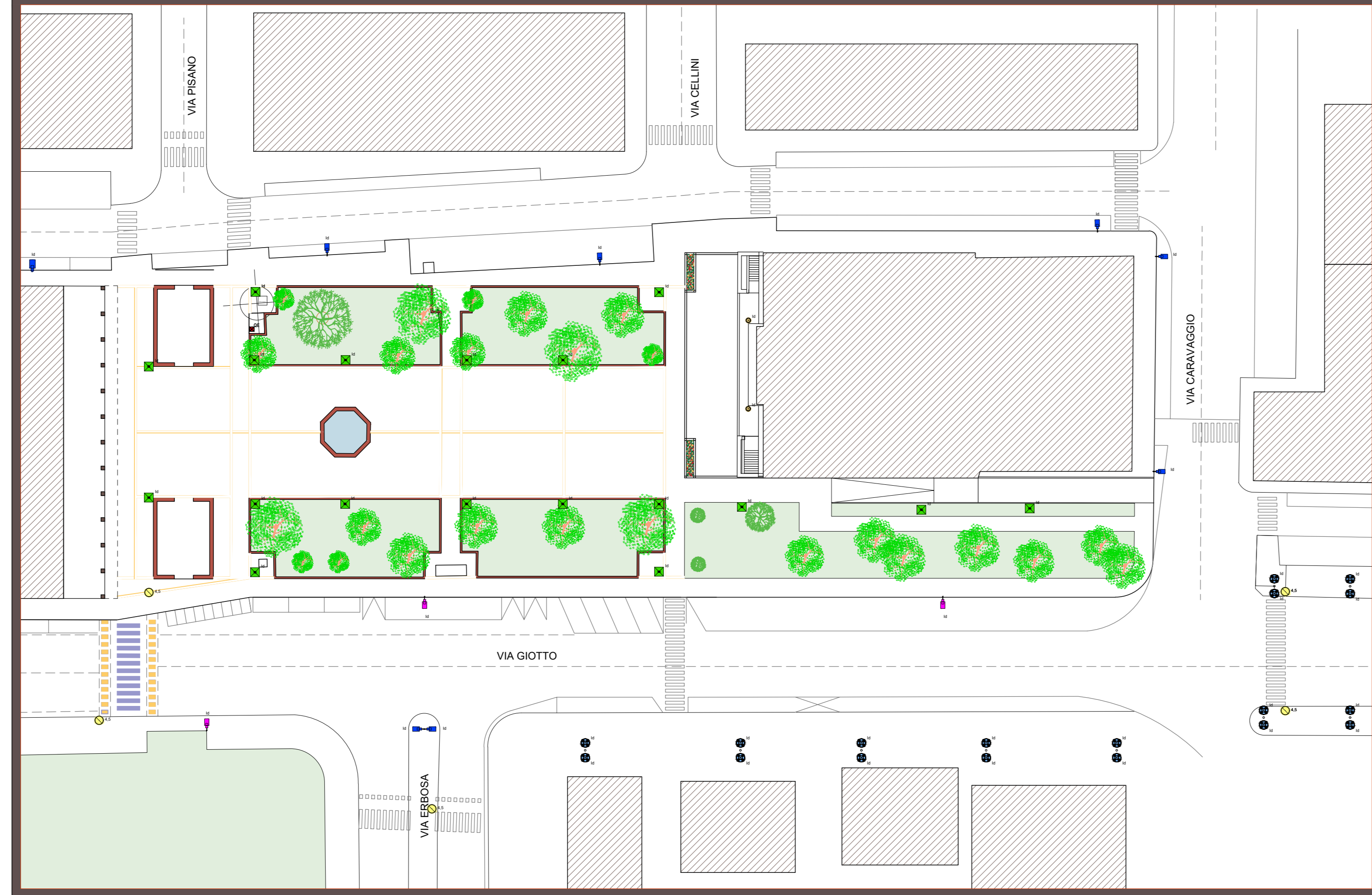
SVILUPPO PLANIMETRICO - RILIEVO IMPIANTO DI ILLUMINAZIONE PUBBLICA ESISTENTE stato dell'arte attuale AR