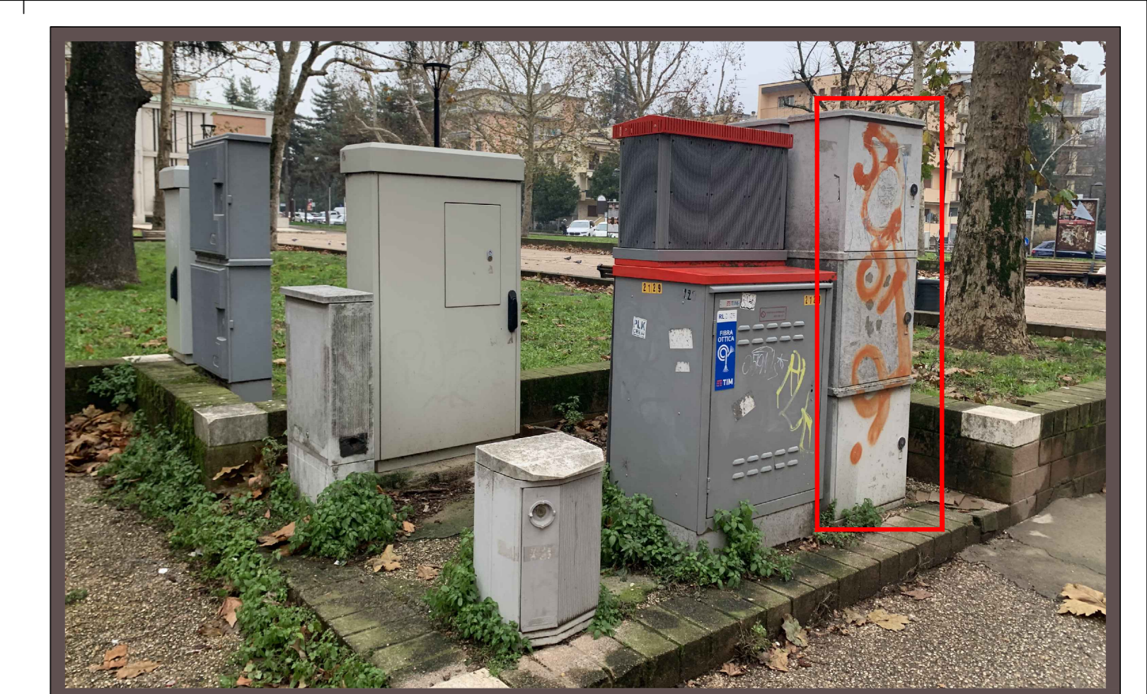
07 - Vista del quadro elettrico esistente FT