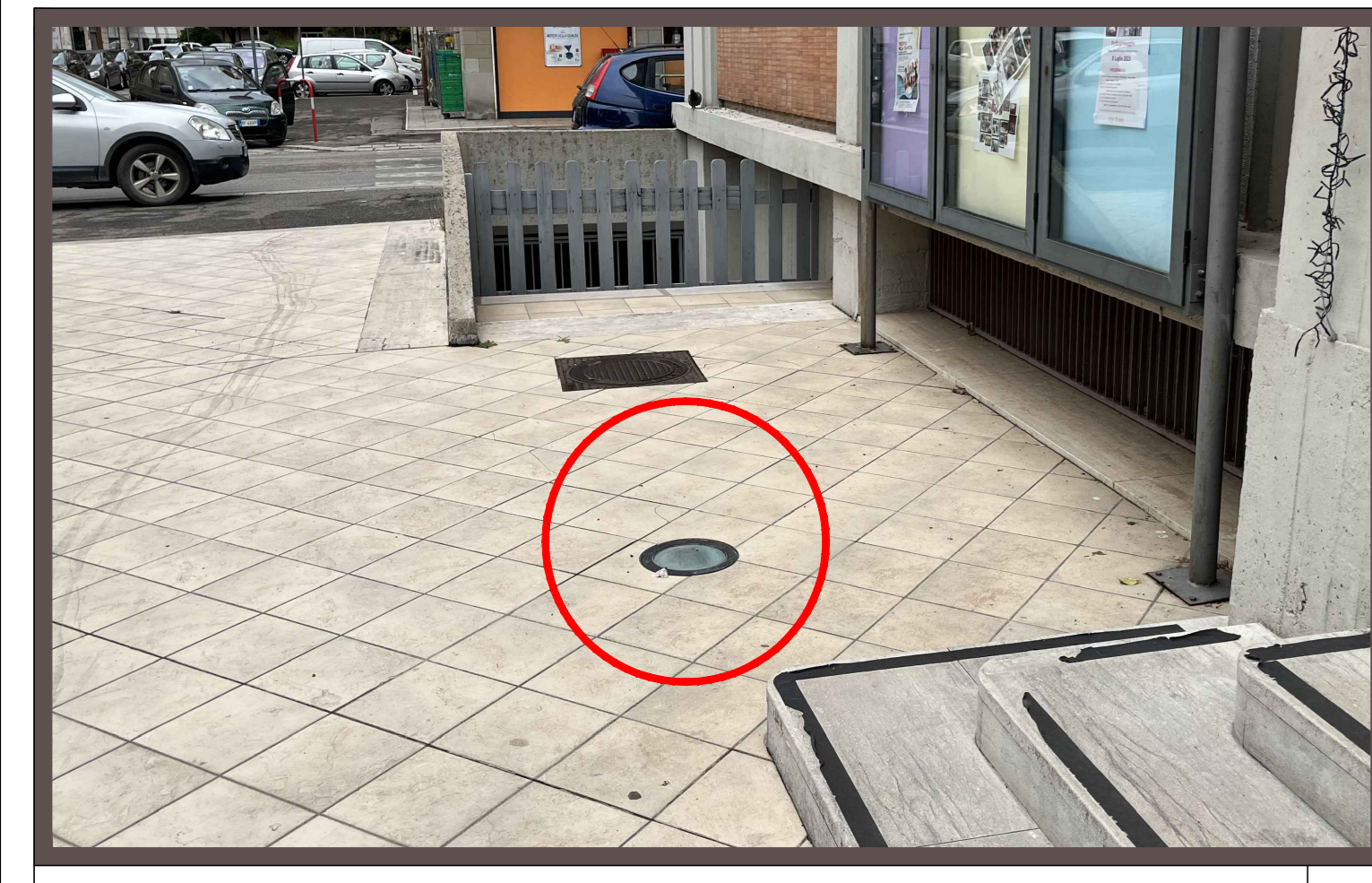
04 - Vista dell'incasso a terra lato ingresso principale chiesa FT